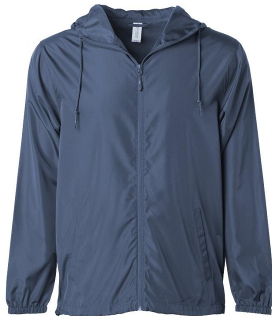
la chaqueta/la chamarra