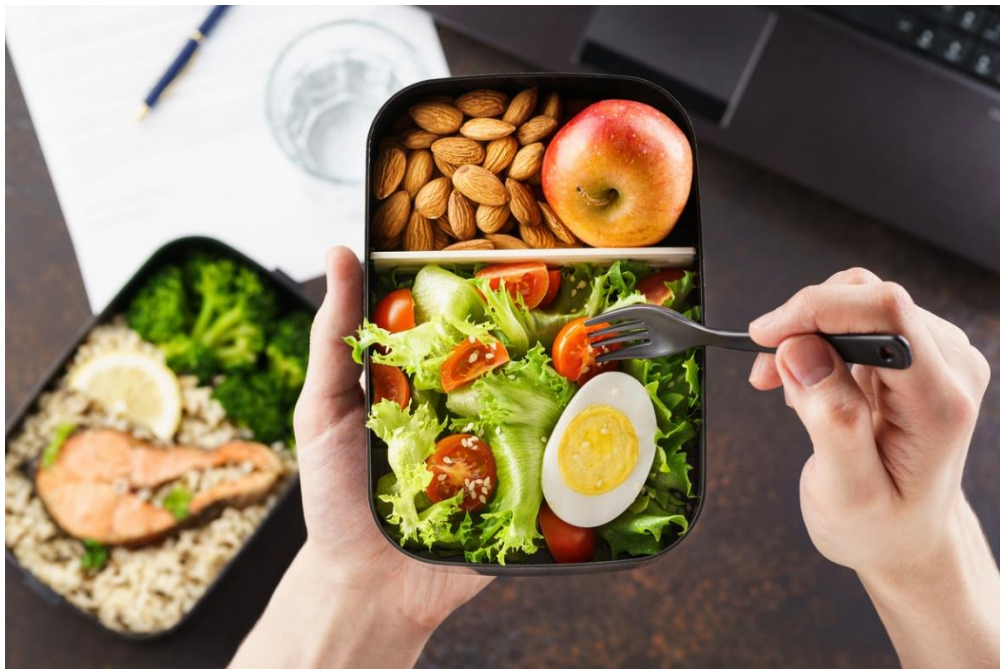
el almuerzo/la comida