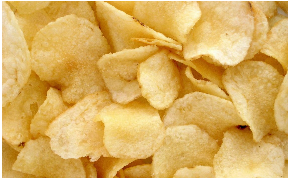
las papas fritas