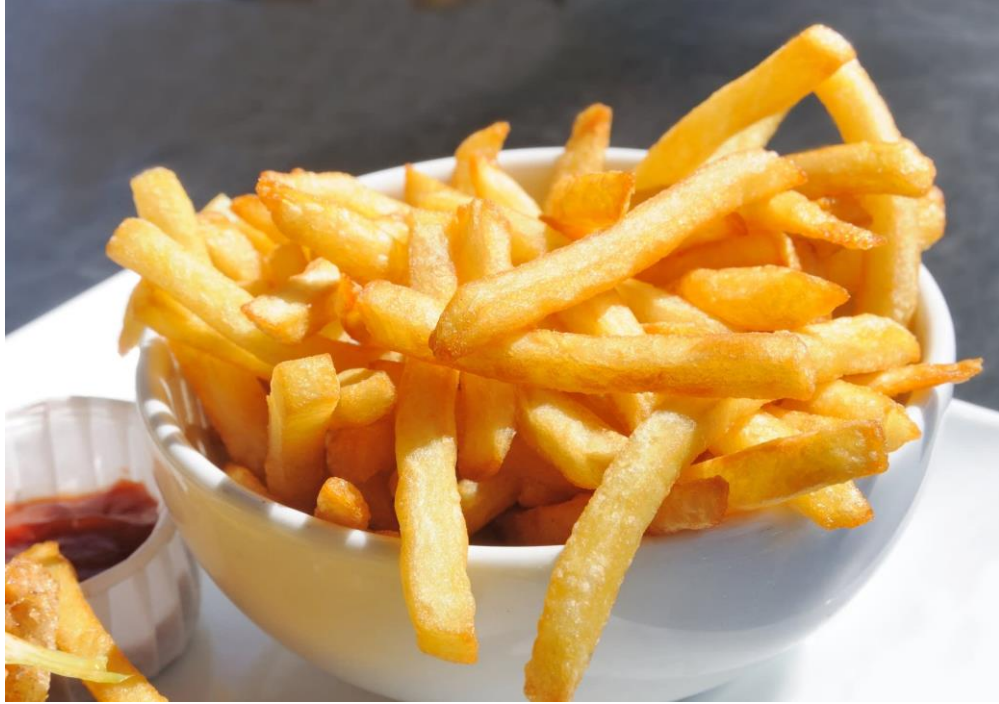
las papas a la francesa