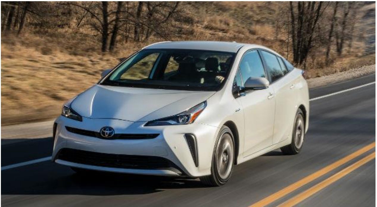
el coche el carro