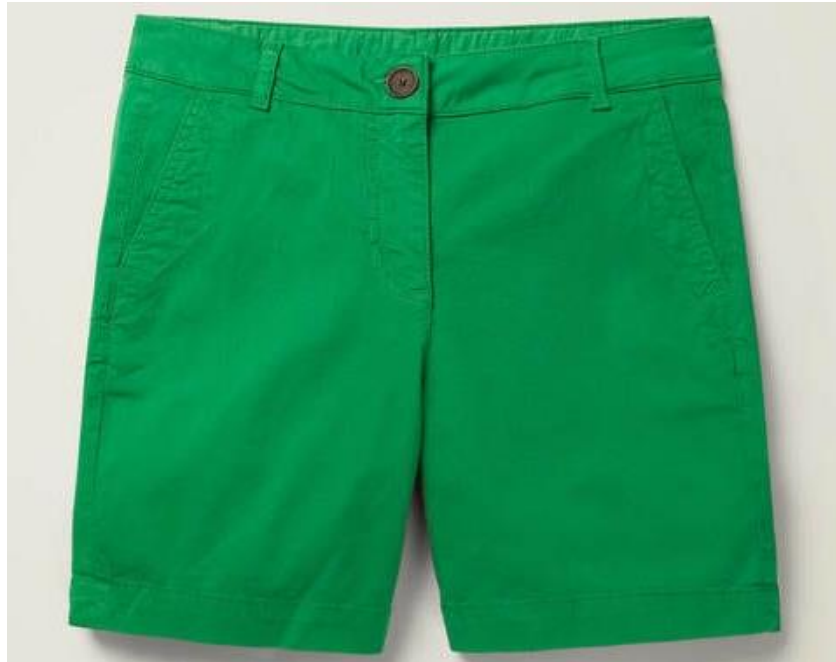
los shorts/los pantalones cortos