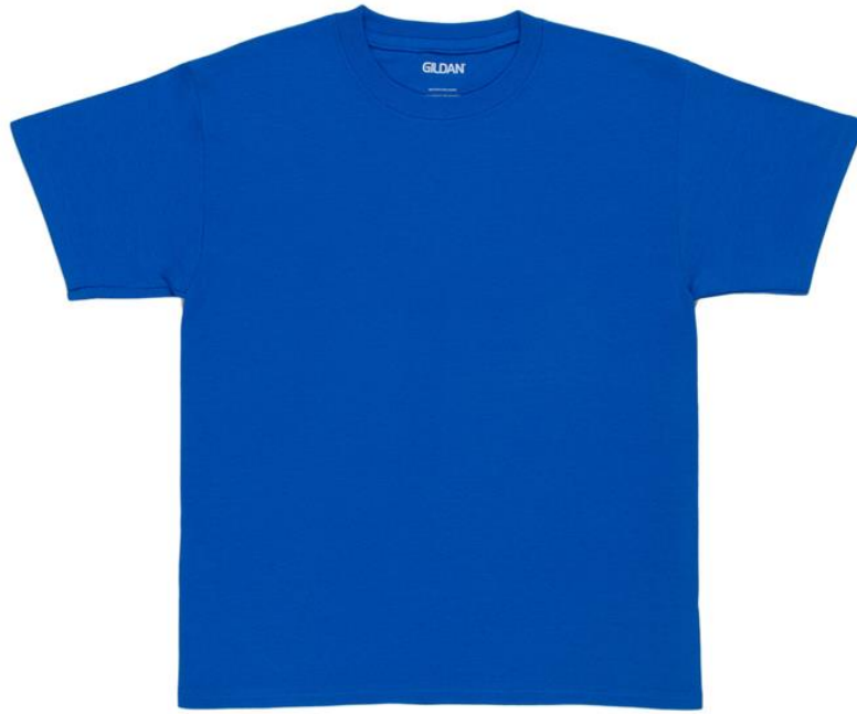
la camiseta/la playera