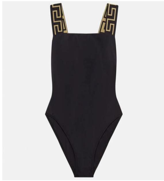
el traje de baño